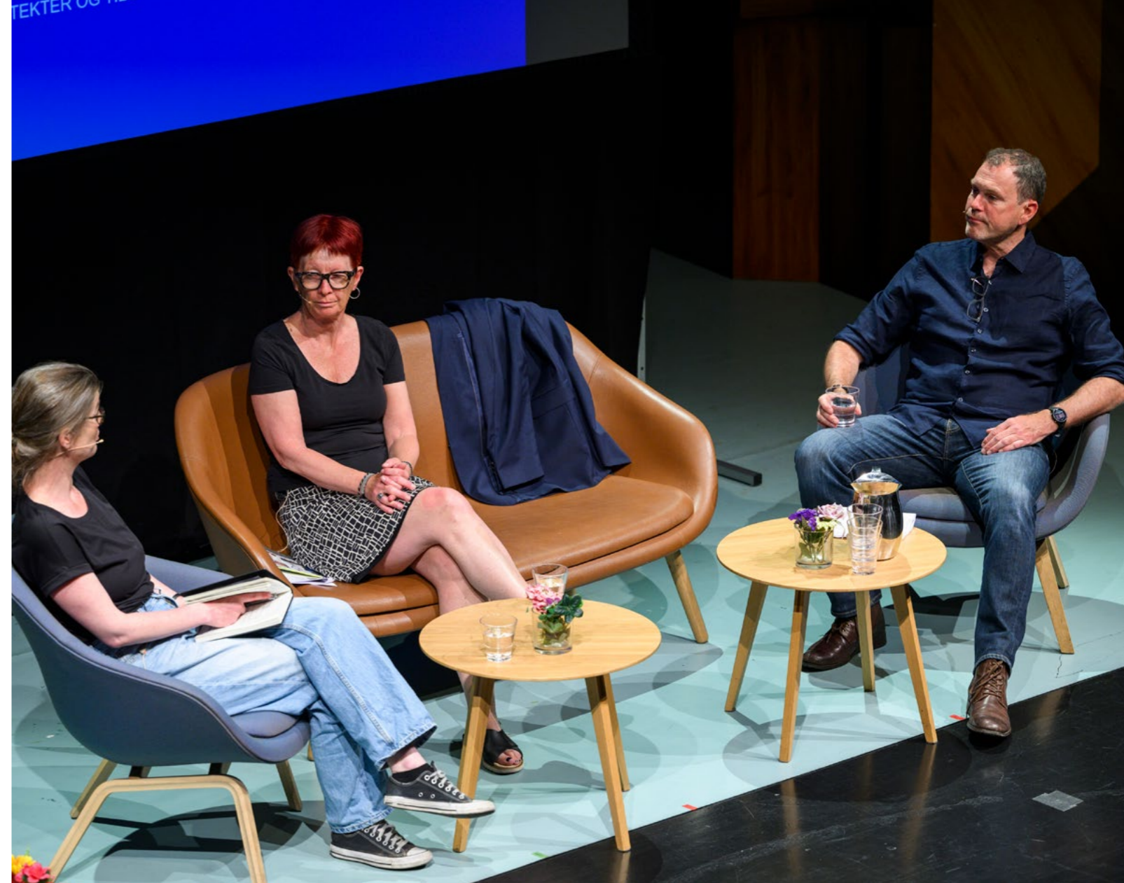
NTO inviterer sine medlemmer til en rekke faglige møteplasser gjennom året. Her fra NTO-seminar under Heddagene

Med det lokale ordskiptet som bakteppe, fulgte vi med dette opp samtalen fra høstseminaret 2022 om scenekunstens verdi og posisjon. Denne gangen ble teaterlederne invitert til å konsentrere samtalen om å utvikle et språk og en ambisiøs grunnargumentasjon som, i et historisk-filosofisk perspektiv,