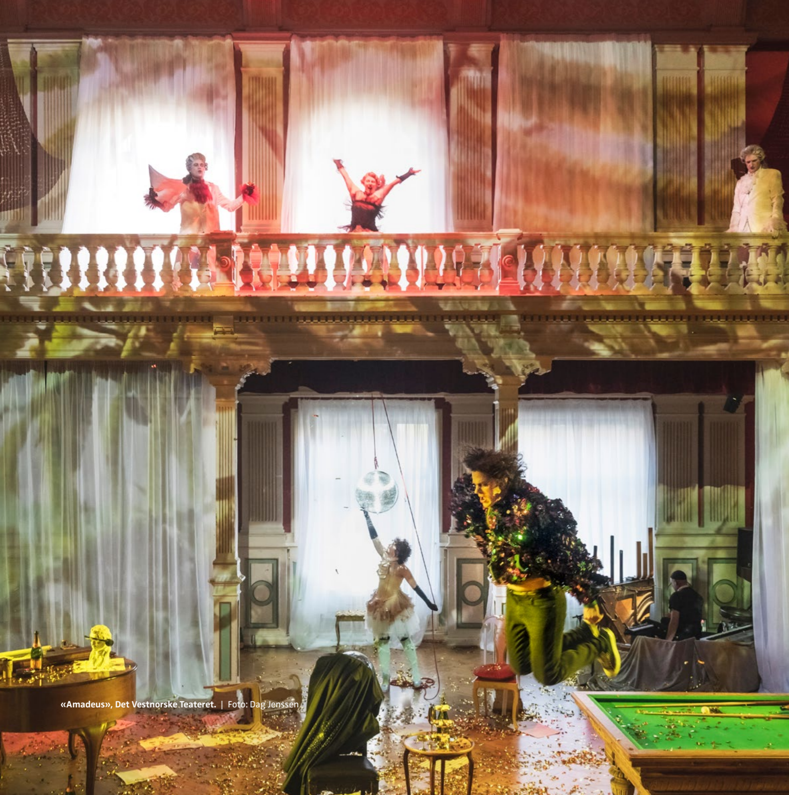
«Amadeus», Det Vestnorske Teateret.