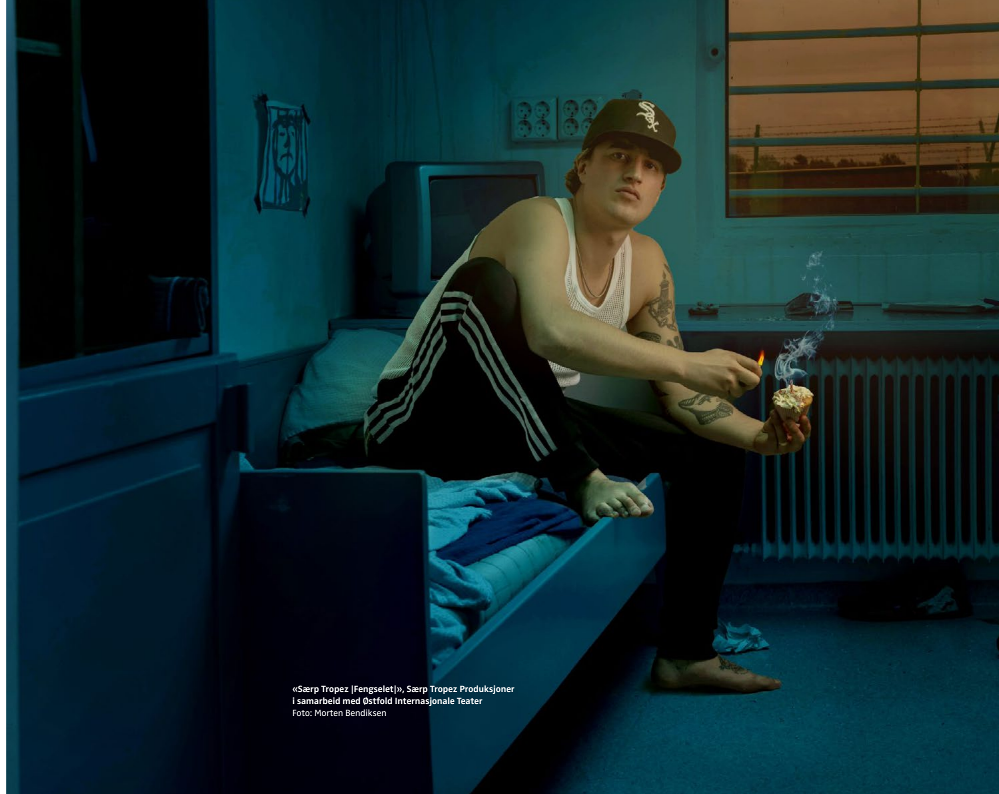
«Særp Tropez [Fengselet]», Særp Tropez Produksjoner i samarbeid med Østfold Internasjonale Teater

Det skal legges betydelig vekt på kontinuitet for å sikre nødvendig kompetanse, balansert mot behovet for fornyelse og at flest mulig av NTOs medlemsvirksomheter over tid engasjeres i styre- og utvalgsarbeid.