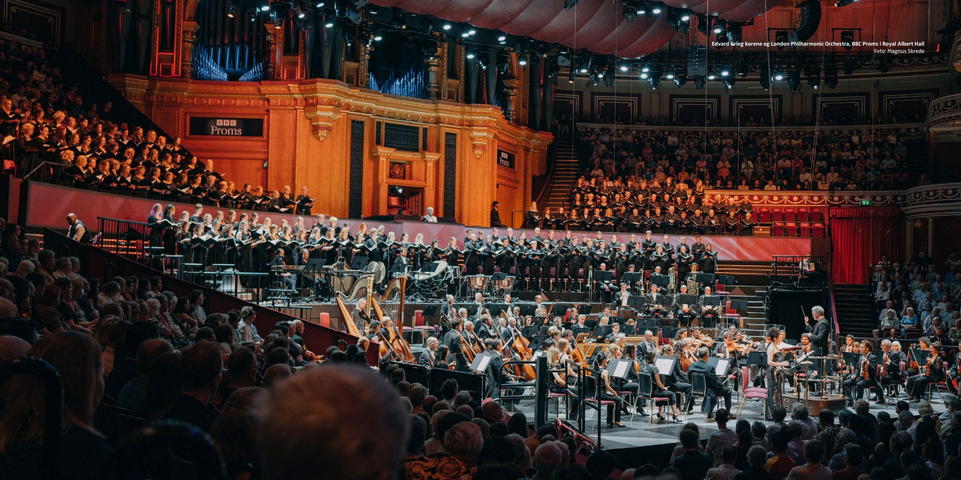
Edvard Grieg korene og London Philharmonic Orchestra, BBC Proms i Royal Albert Hall