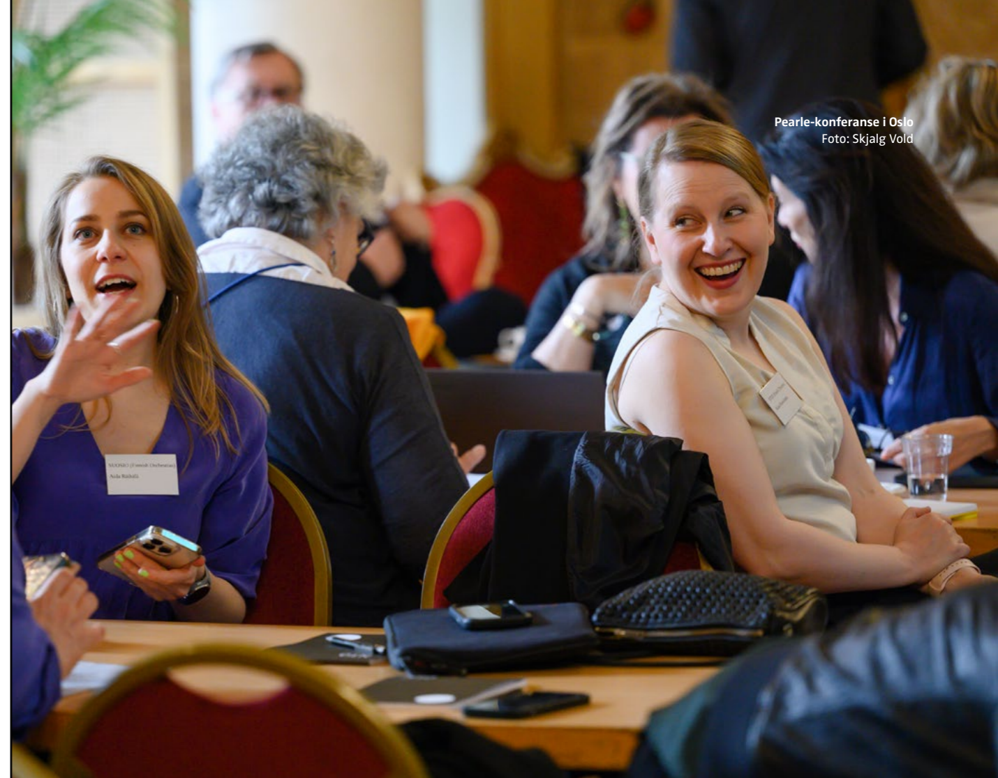
Pearle-konferanse i Oslo

Den andre konferansen i regi av World Expression Forum (Wexfo) ble arrangert i Lillehammer i mai 2023. Etter initiativ fra Den norske Forleggerforeningen ble World Expression Forum formelt stiftet i Oslo 20. august 2021, med NTO blant stifterne.