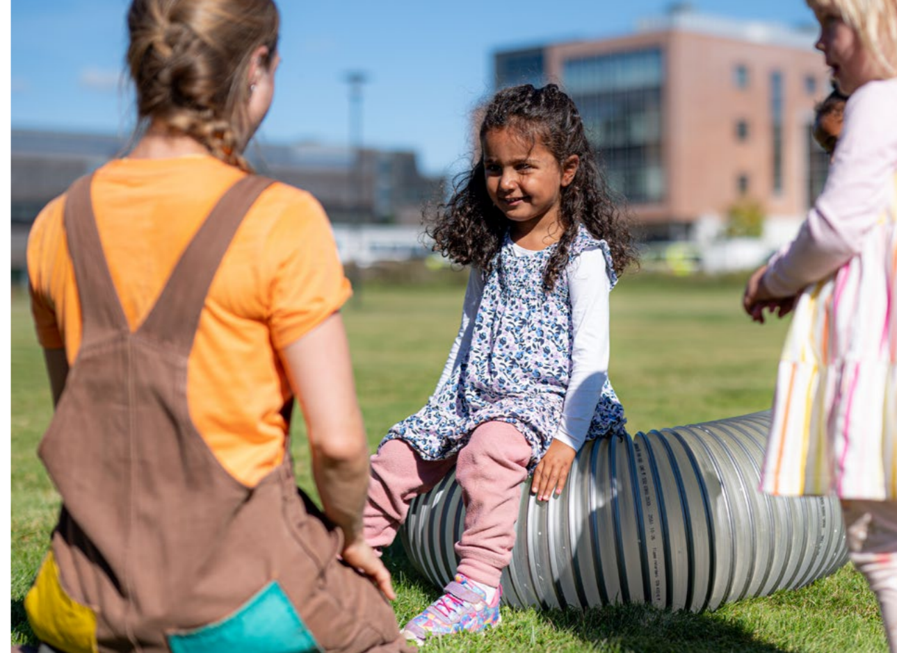
«Bare rør», Panta Rei Danseteater og Unge Viken Teater. Her presentert i samarbeid med Kloden teater under Heddadagene 2023.

Vi pekte også på at en videreføring av driftstilskuddet til Kloden teater, en styrking av Nordic Black Theatre og Scenekunstbruket, samt opprettelsen av et Musikkbruk vil bidra til å gjøre musikken og scenekunsten mer tilgjengelig for barn og unge og befolkningsgrupper som er underrepresentert – både som publikum, deltakere og kunstnere – samt at den allerede eksisterende infrastrukturen slik vil utnyttes bedre for å gi barn og unge tilgang til profesjonell scenekunst der de bor. Vi understreket også at kulturskolen må styrkes slik at tilbudet faktisk blir tilgjengelig for alle på tvers av sosiale,