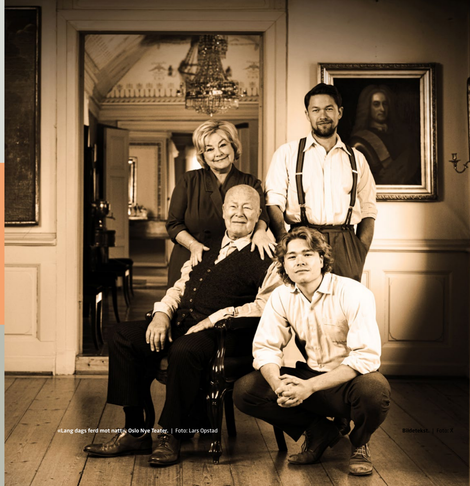
«Lang dags ferd mot natt», Oslo Nye Teater.

ANDEL PUBLIKUMSINNTEKTER AV EGENINNTEKTER*