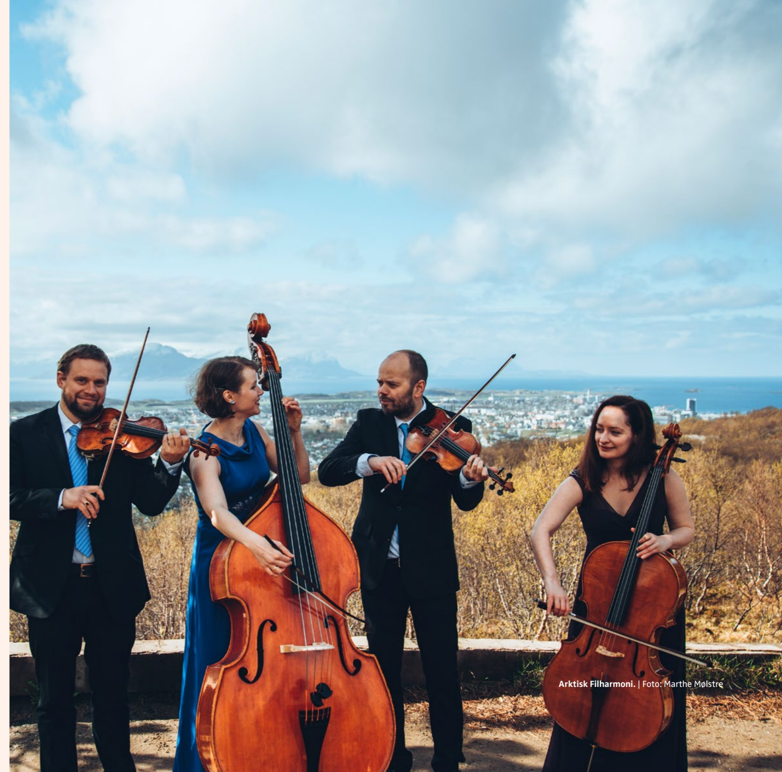
Arktisk Filharmoni.