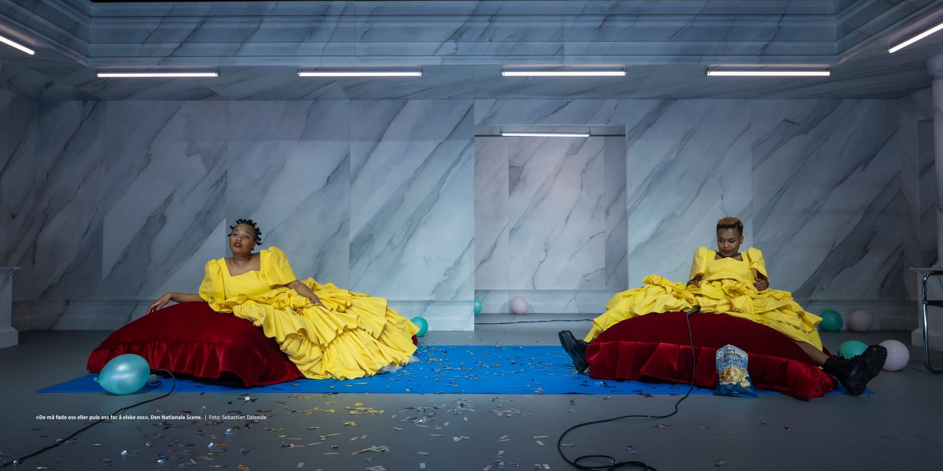
«De må føde oss eller pule oss for å elske oss», Den Nationale Scene.