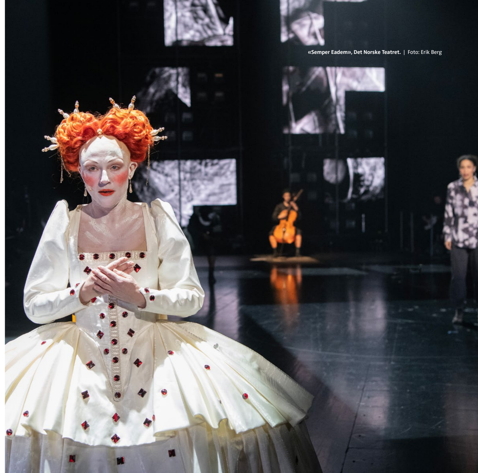
«Semper Eadem», Det Norske Teatret.

NTO inviterer fra tid til annen ulike representanter for musikk- og scenekunstinstitusjonene eller andre aktører til å dele sine betraktninger rundt forskjellige problemstillinger som vedrører bransjen på foreningens hjemmesider og i sosiale mediekkanaler. Bakgrunnen er ofte seminarinnledninger,