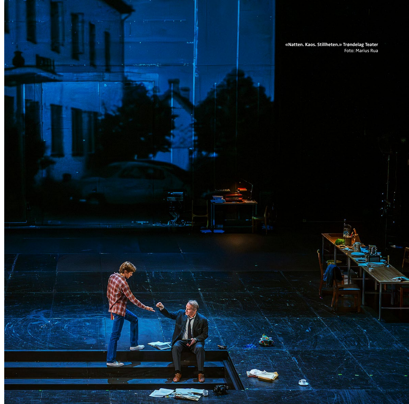
«Natten. Kaos. Stillheten.» Trøndelag Teater

Følgende virksomheter inngår i studien: Hålogaland Teater, Kilden teater og konserthus, Nordland Teater, Stavanger Symfoniorkester, DansiT, Rosendal Teater, Trondheim Symfoniorkester & Opera, Trøndelag Teater og Turnéteatret i Trøndelag.