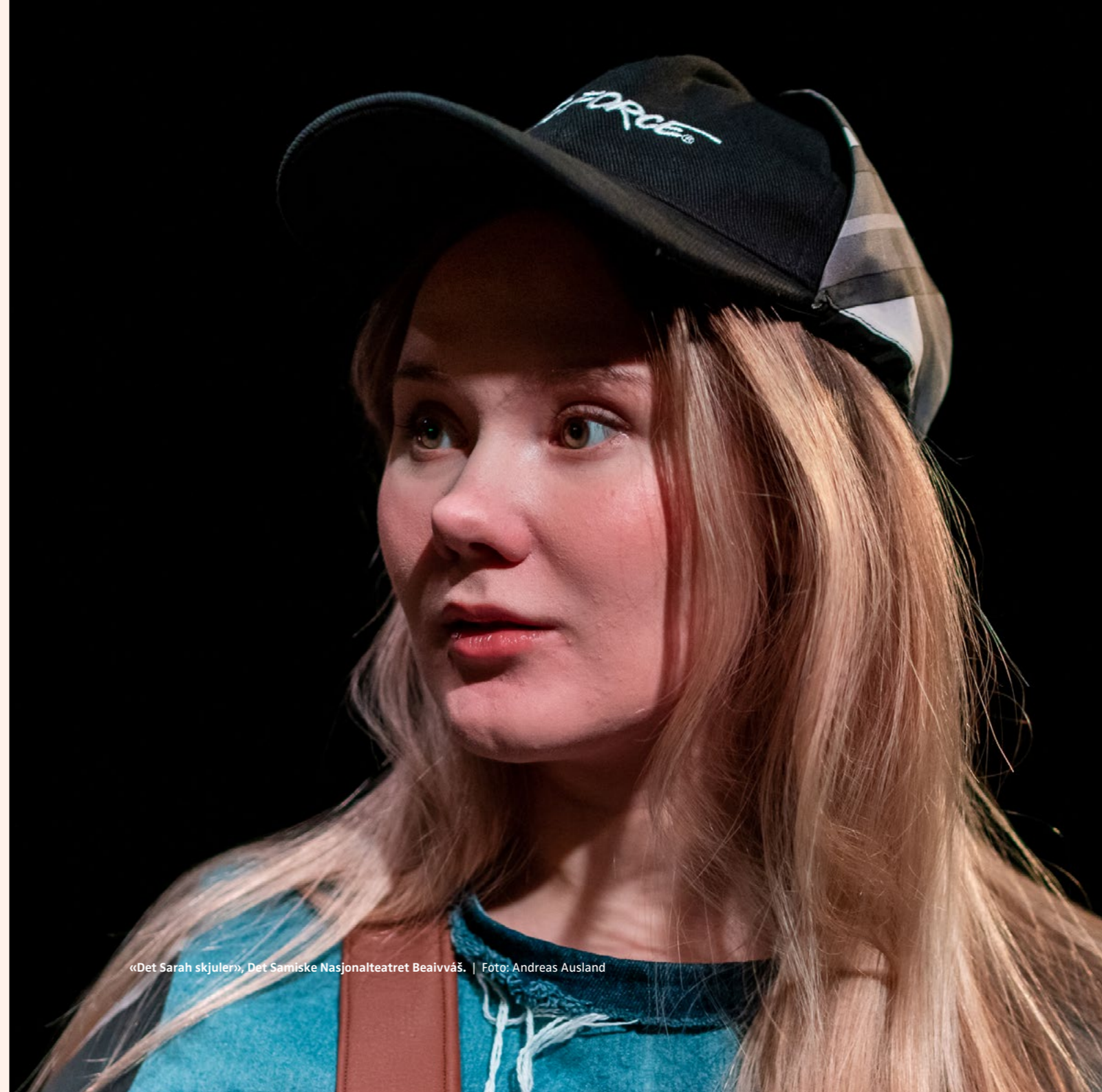
«Det Sarah skjuler», Det Samiske Nasjonalteatret Beavivváš.

DE FØLGENDE TO DOKUMENTENE ER UTARBEIDET TIL BRUK I FORENINGENS BEREDSKAP SARBEID, FOR MER SPESIFIKT Å KUNNE FORSVARE PRINSIPPET OM EN ARMLENGDES AVSTAND MELLOM POLITIKK OG KUNST, SAMT BIDRA TIL STØRRE BEVISSTHET OG KUNNSKAP I OFFENTLIGHETEN OM HVA KUNSTNERISK FRIHET ER OG HVILKEN VERDI DEN HAR.