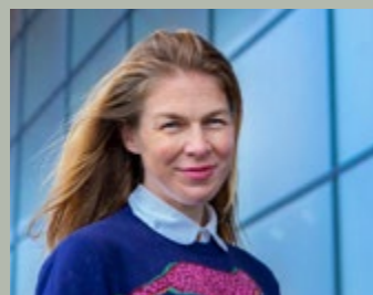
Varamedlem Valborg Frøysnes