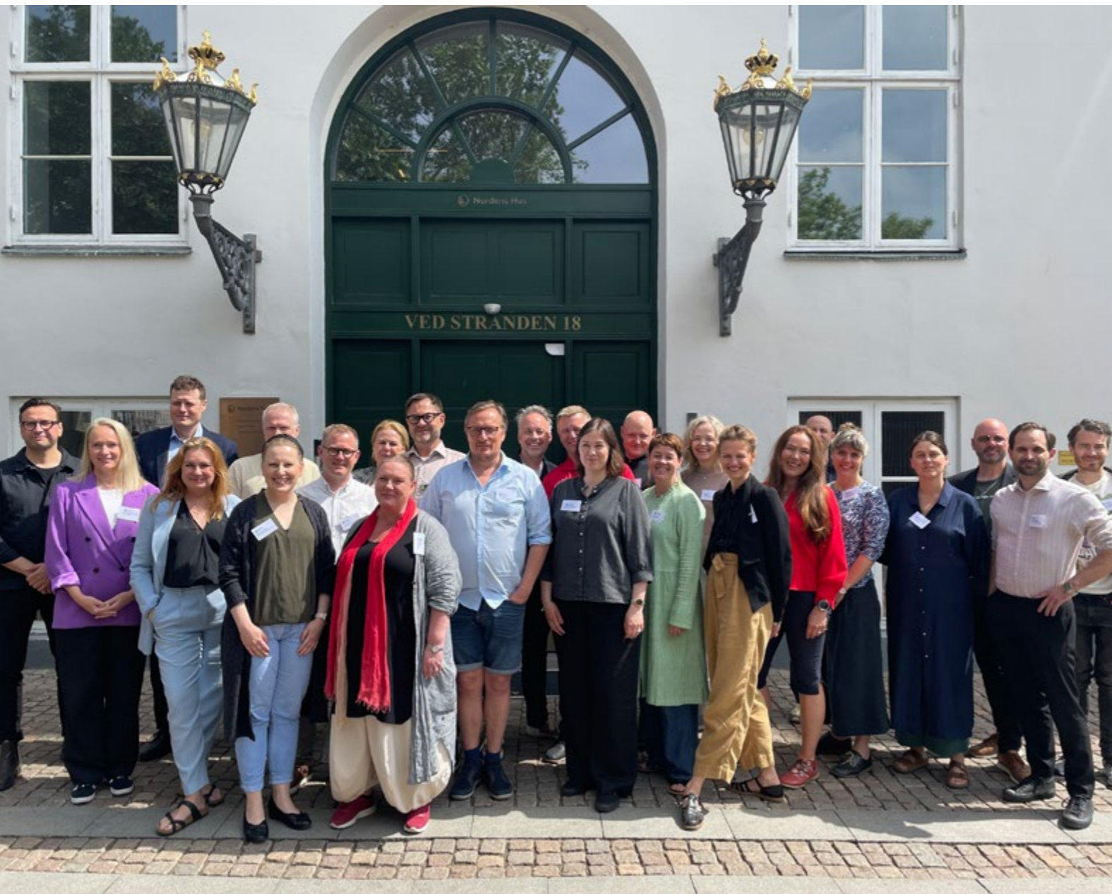
Fra kick-off i København i mai 2024 for andre runde av Nordic Ambitions