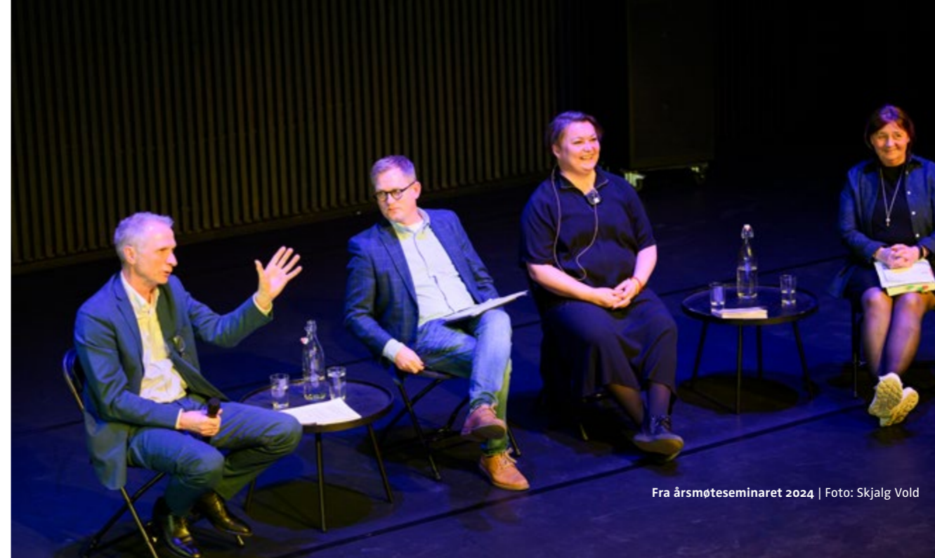
Fra årsmøteseminaret 2024