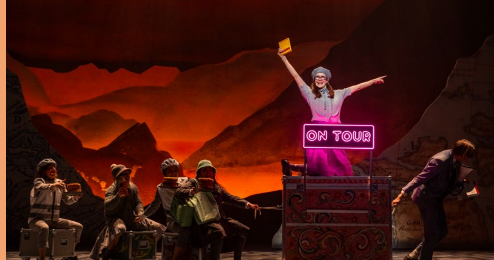
«Sjynorsk. The Musical», Det Norske Teatret