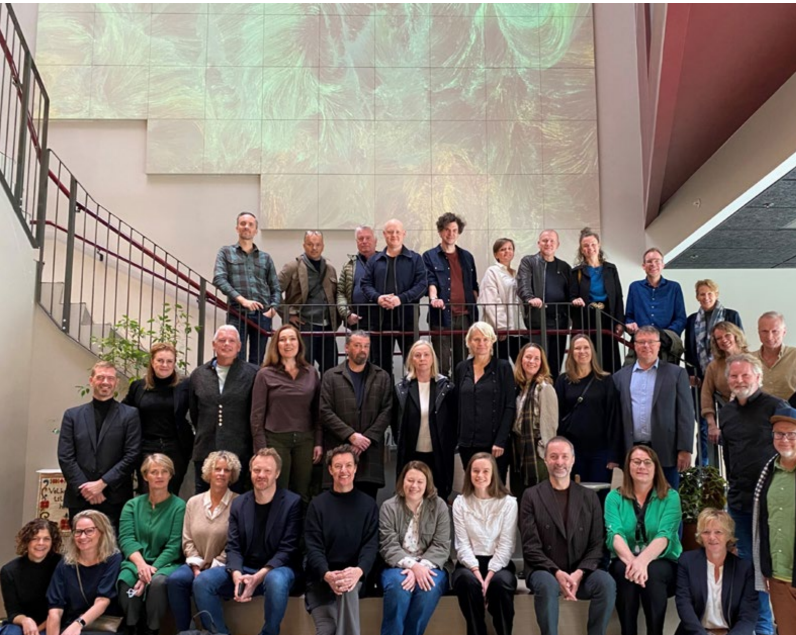
Teaterlederne samlet på seminar. Her fra besøk ved Teater Vestland høsten 2023

Forumet har som formål å bidra til teaterledernes gjensidige forståelse og faglige utvikling gjennom menings- og erfaringsutveksling om scenekunsthaglige og interessepolitiske spørsmål. Forumet er også en innspillsarena for NTOs interessepolitiske arbeid.