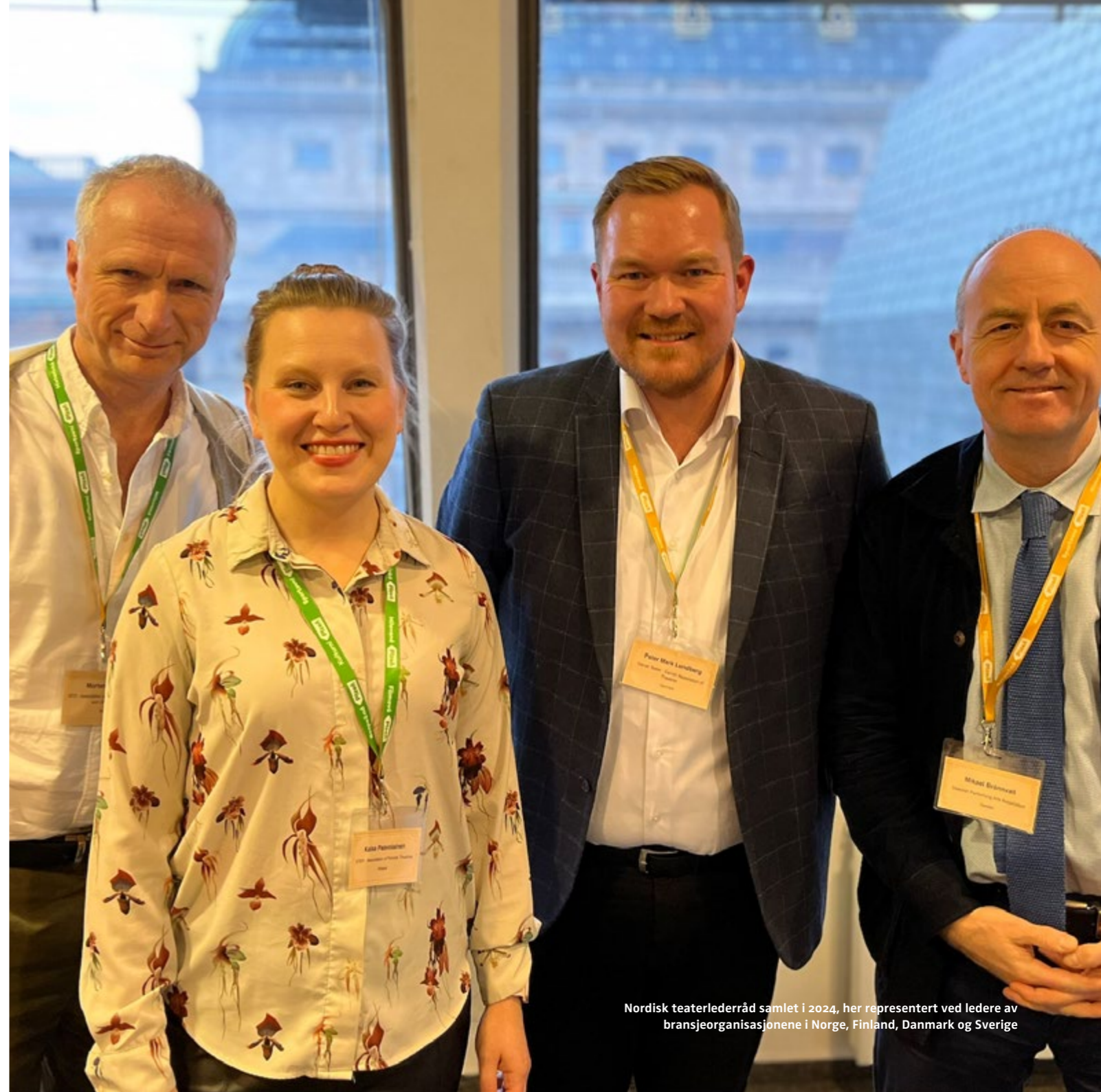
Nordisk teaterlederråd samlet i 2024, her representert ved ledere av bransjeorganisasjonene i Norge, Finland, Danmark og Sverige