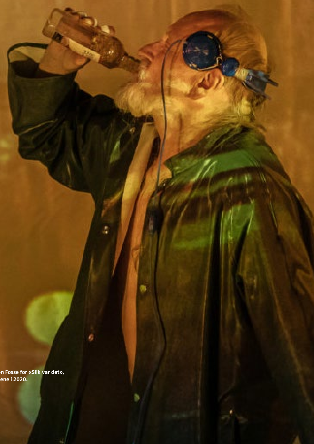
Den nasjonale Ibsenprisen gikk i 2021 til Jon Fosse for «Slik var det», som hadde urpremiere på Den Nationale Scene i 2020.

I 2021 ble det tatt initiativ til reforhandling av avtalene på teaterområdet med henholdsvis TONO, NOPA og Norsk Komponistforening. Avtalene vil bli reforhandlet i 2022, og er i den forbindelse prolongert ut 2022.