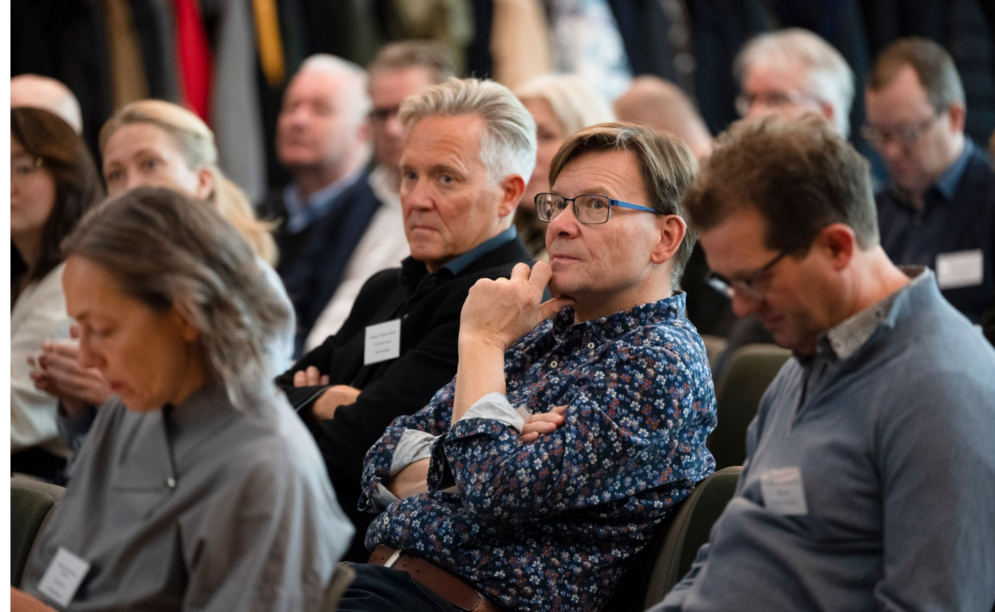
NTO arrangerer en rekke seminarer og konferanser hvor medlemmene gis muligheter til å holde seg oppdatert om utviklingen i bransjen og knytte kontakter

En rød tråd gjennom seminaret var spørsmålet om hva vi vil med den digitale satsingen. Hvilke langsiktige mål har institusjonene for sine ulike, særskilte digitale satsinger? Hvordan balanseres ressursene internt? Hvordan bygger vi nødvendig bransjespesifikk kompetanse for en ny tid