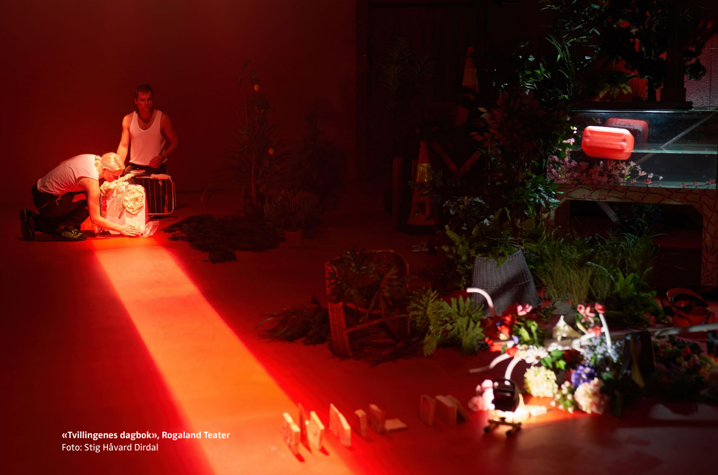
«Tvillingenes dagbok», Rogaland Teater