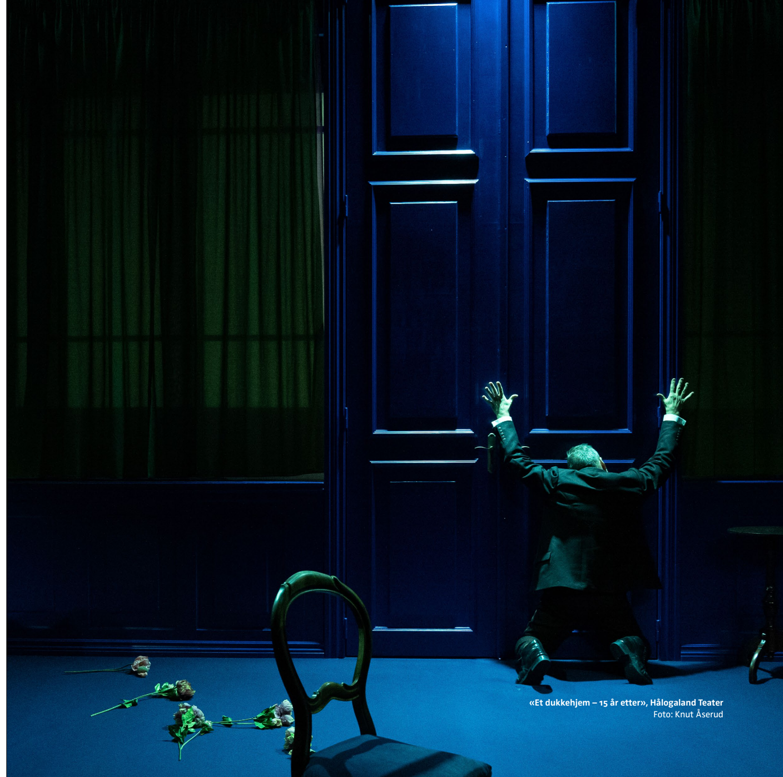
«Et dukkehjem – 15 år etter», Hålogaland Teater

NTO ba derfor i begynnelsen av desember myndighetene om ikke å ukritisk gripe til antallsrestriksjoner og nedstenging av kulturlivet med den generelle henvisning til å få ned mobiliteten i samfunnet, men snarere søke å kombinere god smittekontroll med et åpent sivilsamfunn, som blant annet legger til rette for kunstneriske ytringer og levende kunstmøter.