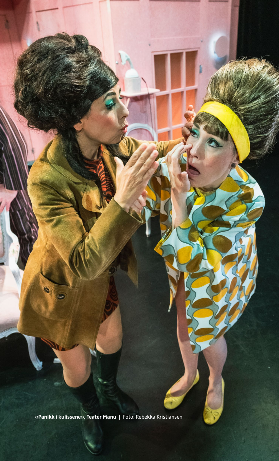
«Panikk i kullissene», Teater Manu | Foto: Rebekka Kristiansen