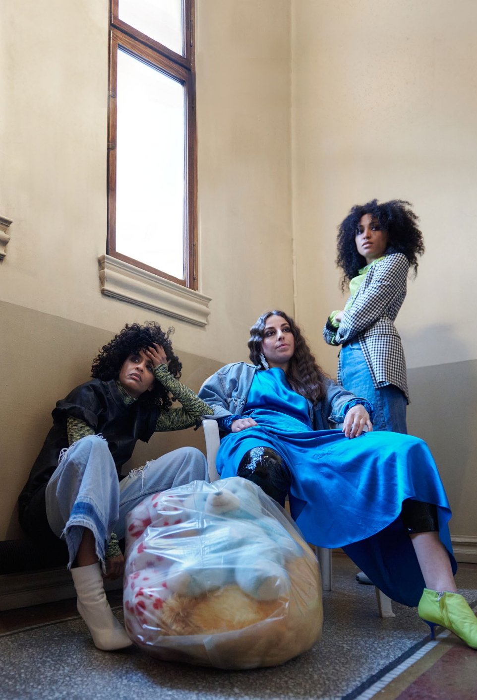
«De må føde oss eller pule oss for å elske oss», Nationaltheatret