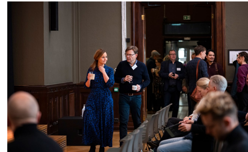
I oktober kunne endelig nordiske orkesterkolleger treffes i Oslo til faglig påfyll og viktig erfaringsutveksling i forbindelse med Nordisk orkesterkonferanse.

Veikartet inneholder en rekke straktiltak som vil gi effektfulle endringer og kan tilpasses den enkelte kunstner, kulturarbeider og virksomhets forhold og behov.