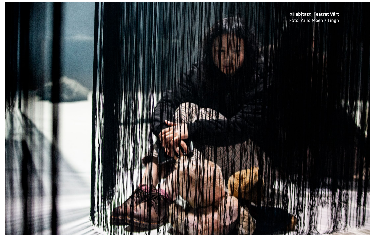
«Habitat», Teatret Vårt

Samtidig var vi glade for at det i strategien varsles at systemet for periodiske og dialogbaserte institusjonsevalueringer skal videreutvikles, samt at den kvalifiserte kritikken skal styrkes.