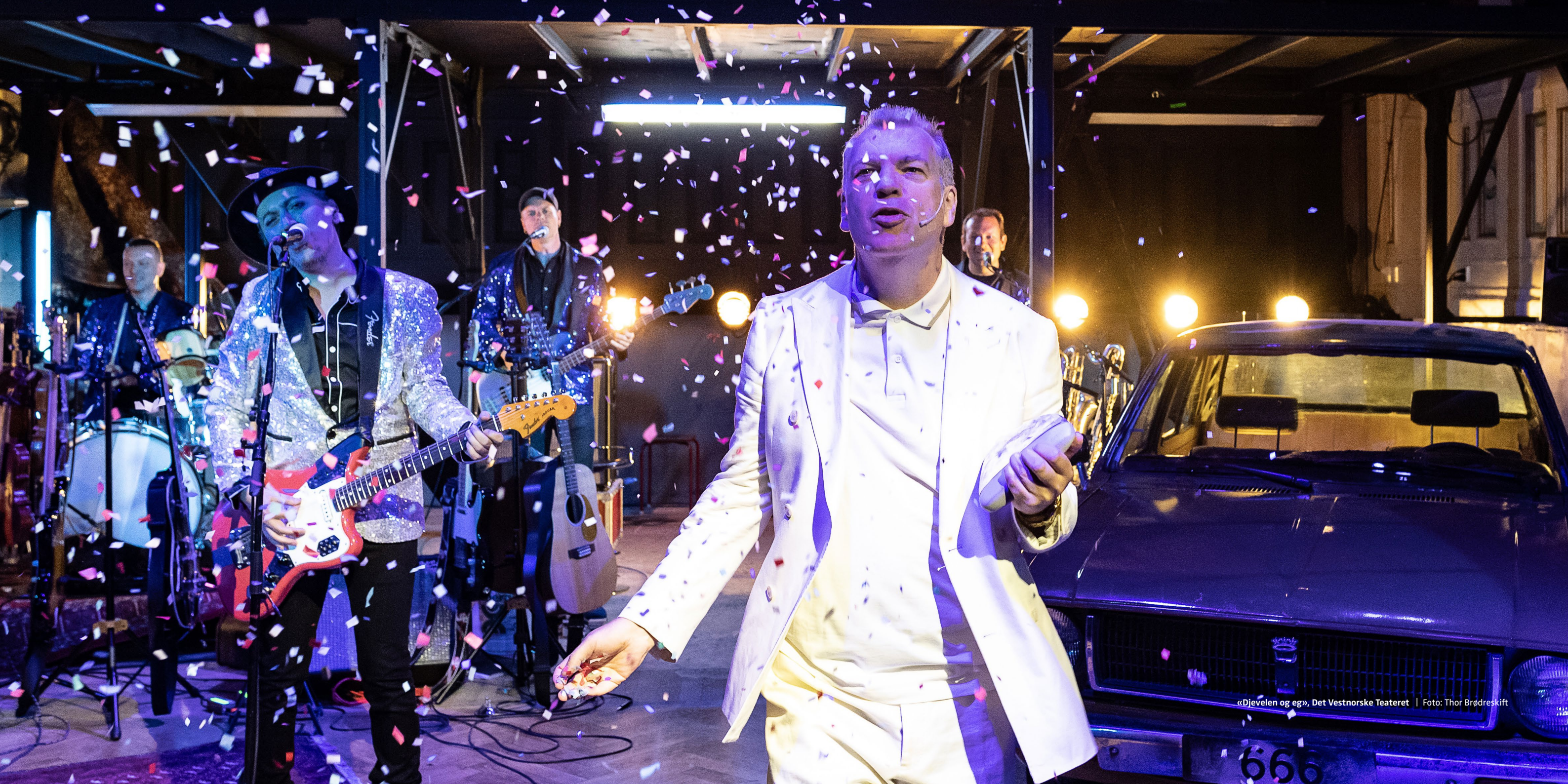
«Djevelen og eg», Det Vestnorske Teateret