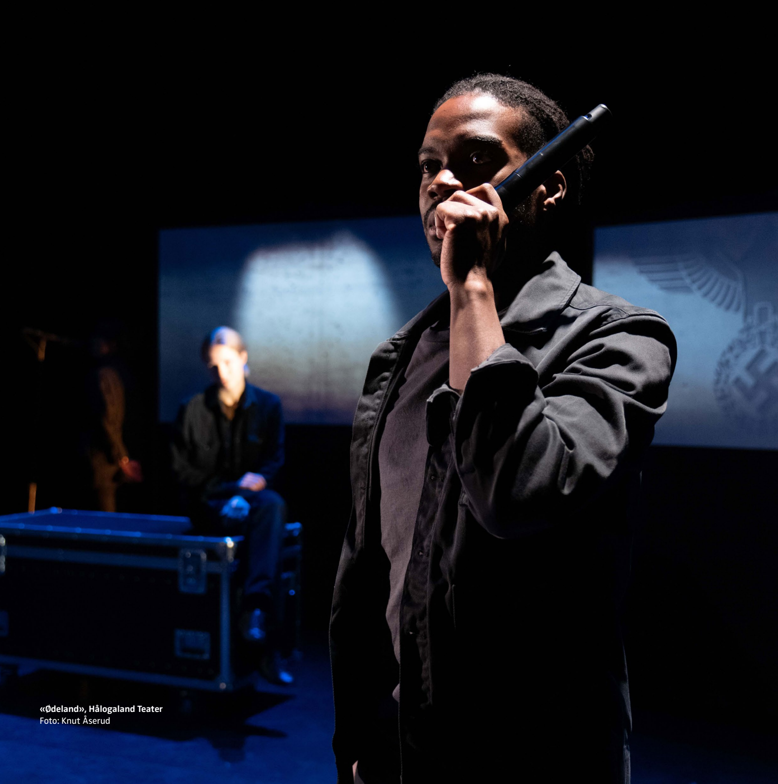
«Ødeland», Hålogaland Teater

internasjonal økonomi, med årlige arrangementer i Lillehammer i mai måned. Det første styret har forlagssjef Mads Nygaard, Aschehoug, som styreleder.