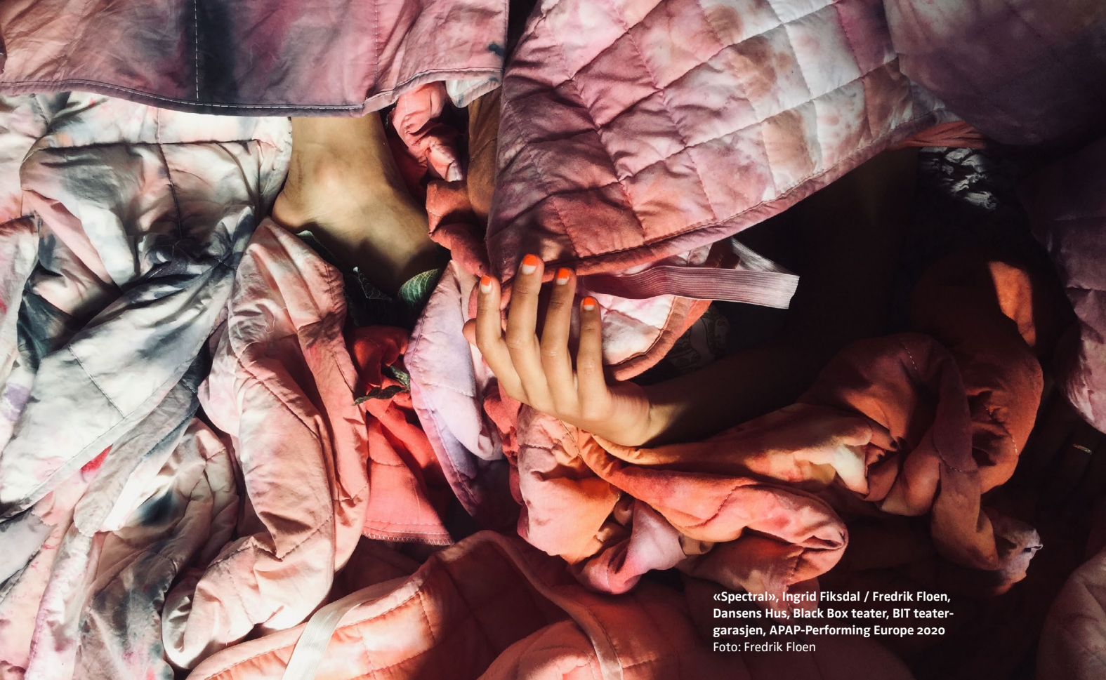
«Spectral», Ingrid Fiksdal / Fredrik Floen, Dansens Hus, Black Box teater, BIT teater- garasjen, APAP-Performing Europe 2020

I vårt innspill 16. desember til utformingen av en ny forskriftsfestet tilskuddsordning som skal sikre større økonomisk forutsigbarhet for etablerte kompanier, understreket vi at mest mulig midler må kanaliseres direkte til kompaniene og minst mulig til administrasjon, og at det derfor er lite tjenlig å etablere nye organer for å vurdere kompanienes kunstneriske kvalitet. Mange av disse kompaniene er viktige samarbeidspartnere for NTOs medlemmer, og programmerende teatre som Black Box teater, BIT Teatergarasjen, Rosendal Teater og Dansens Hus er for eksempel blant de viktigste formidlerne og co-produsentene av mange av scenekunstkompanienes forestillinger.