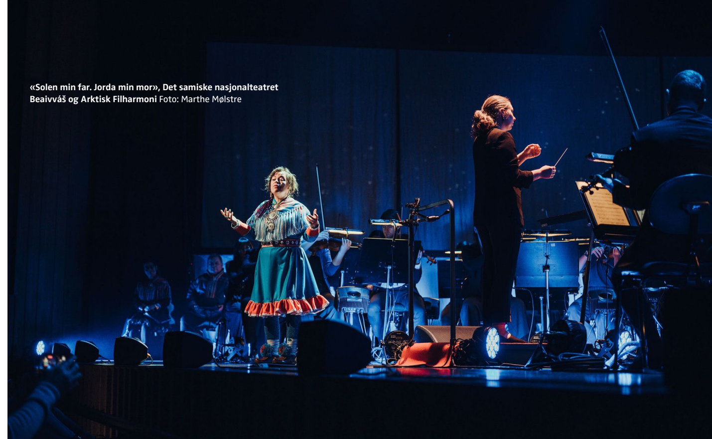
«Solen min far. Jorda min mor», Det samiske nasjonalteatret Beaivváš og Arktisk Filharmoni

Faglige vurderinger og faglig utvikling skal finne sted på fritt grunnlag i hver enkelt institusjon ut ifra den enkelte virksomhetens egenart og kunstneriske profil som er definert av den til enhver tid sittende kunstneriske