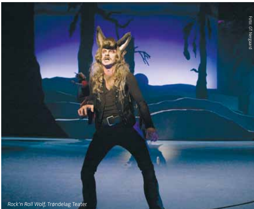
Rock'n Roll Wolf, Trøndelag Teater

Samtidig bidrar regelen til å sementere de tradisjonelle skillene mellom institusjonene og det frie feltet, i stedet for å legge til rette for samarbeid. De siste årene har det vært en økning i