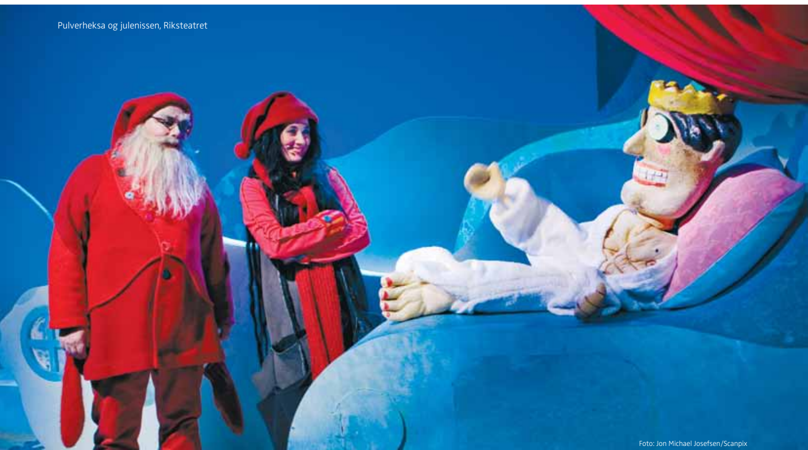
Pulverheksa og julenissen, Riksteatret