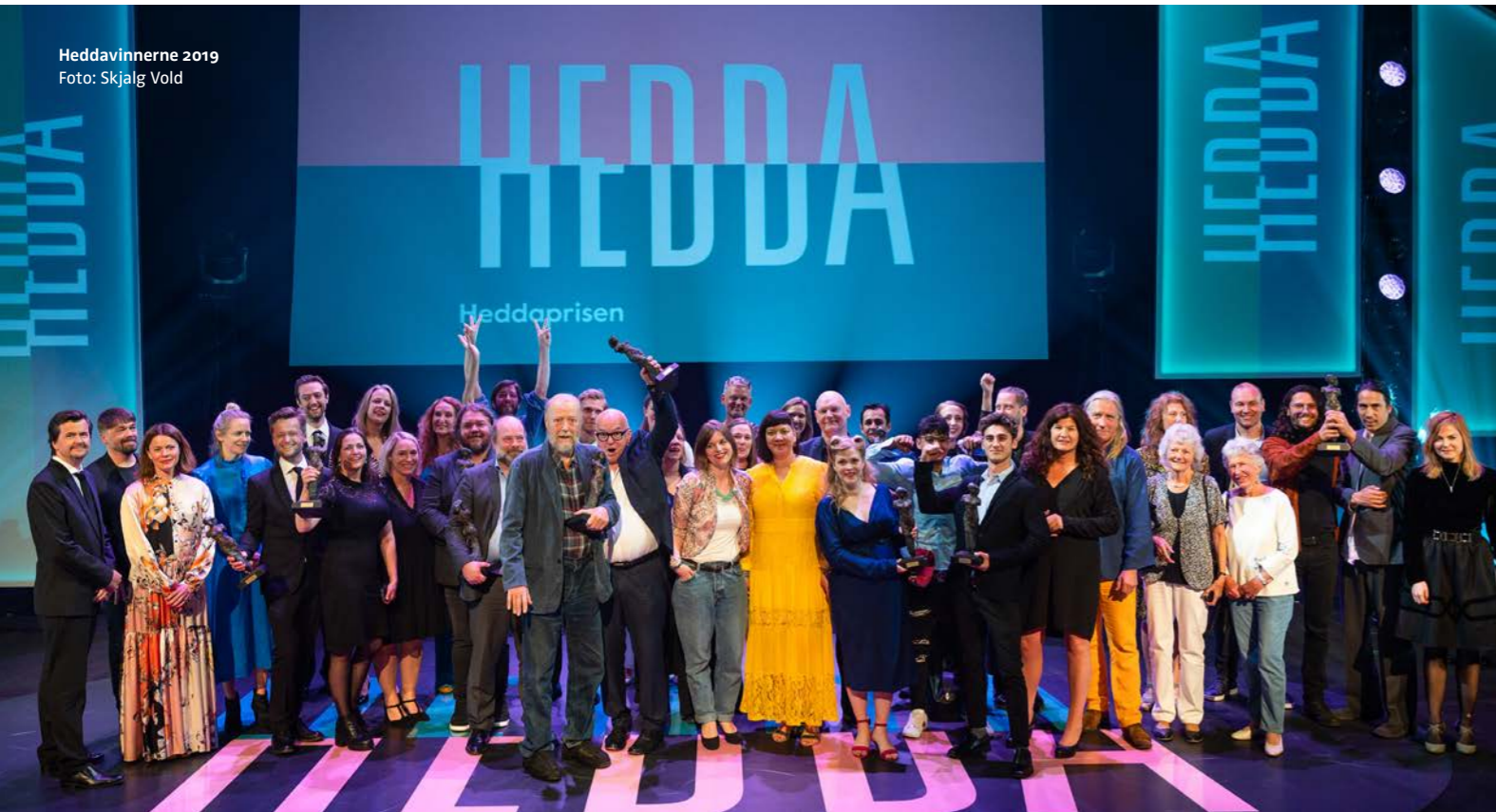
Heddavinnerne 2019