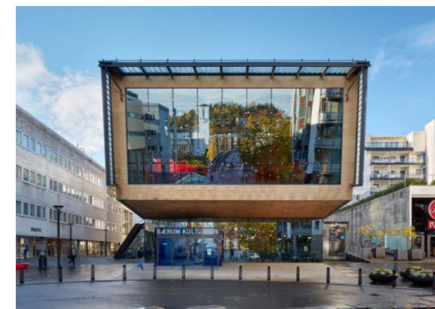
Bærum Kulturhus

NTO er fornøyd med at forprosjekt for rehabiliteringen av Nationaltheatret er godt i gang. Går alt som planlagt vil teatret ha behov for et midlertidig oppholdssted fra høsten 2021