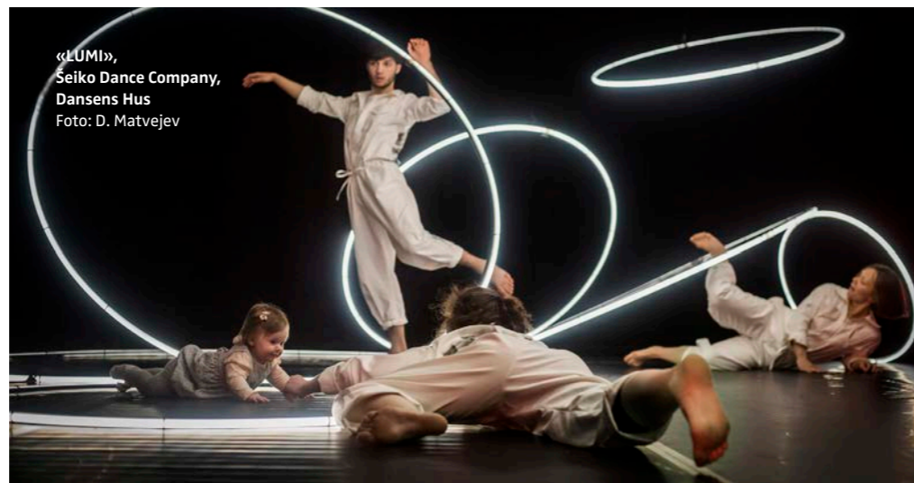
«LUMI», Seiko Dance Company, Dansens Hus