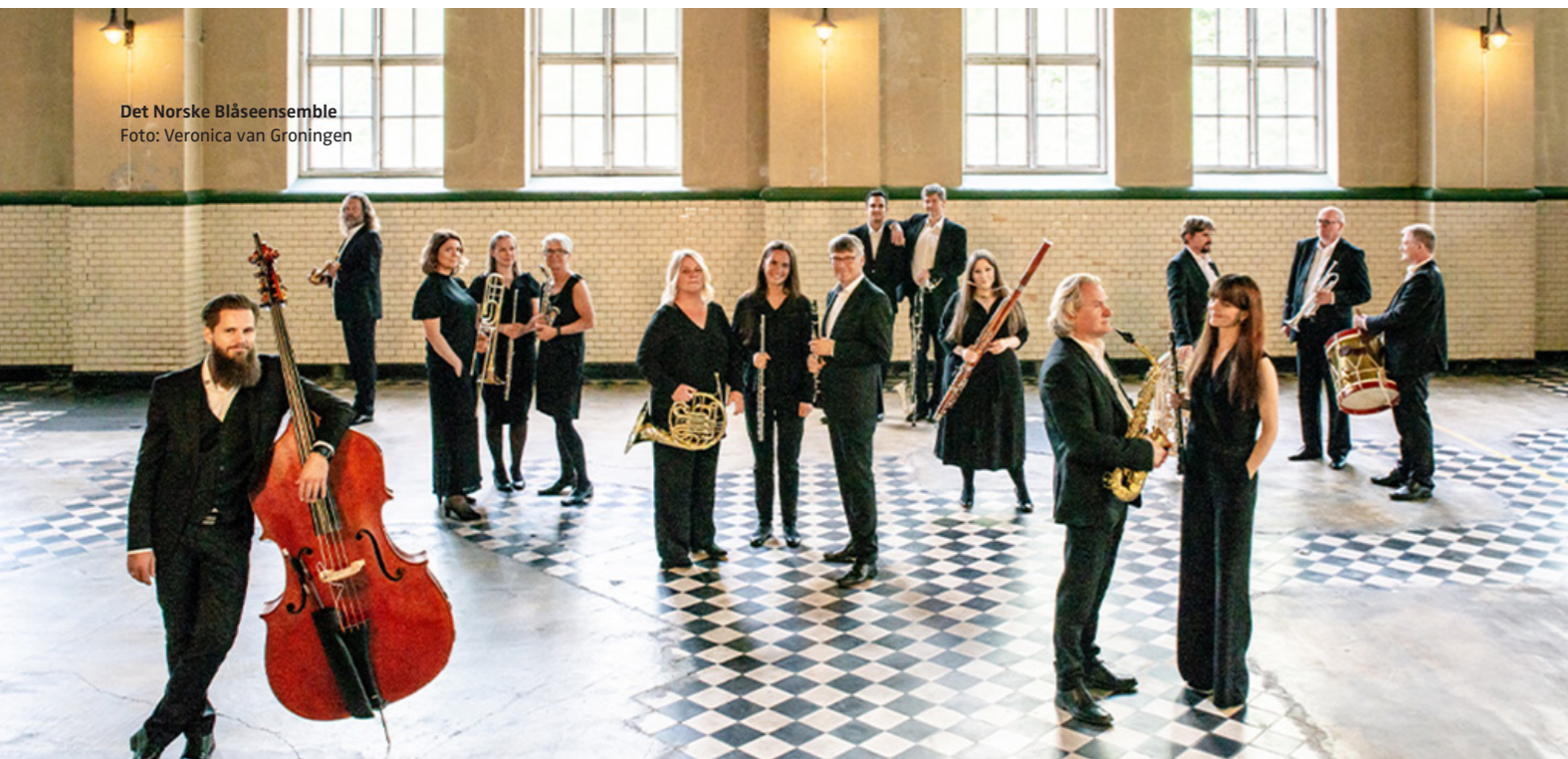
Det Norske Blåseensemble

5. februar leverte vi vårt innspill til den kommende kunstnermeldingen. Vi pekte blant annet på at musikk- og scenekunstinstitusjonene utgjør en betydelig del av infrastrukturen rundt de frittstående kompaniene og ensemblene. Kunstnere beveger seg mellom både institusjoner, kompanier og prosjekter i et differensiert arbeidsmarked. I denne situasjonen tilbyr institusjonene trygghet og forutsigbarhet gjennom fast ansettelse og gode arbeidsvilkår.