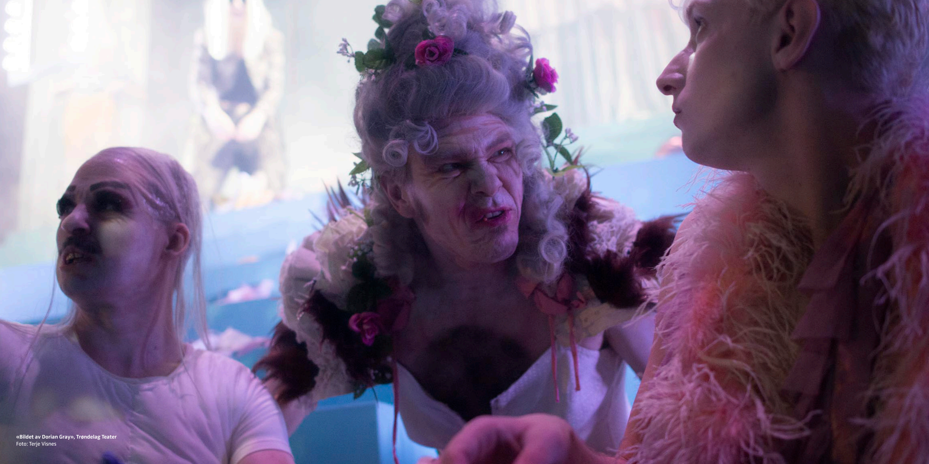
«Bildet av Dorian Gray», Trøndelag Teater