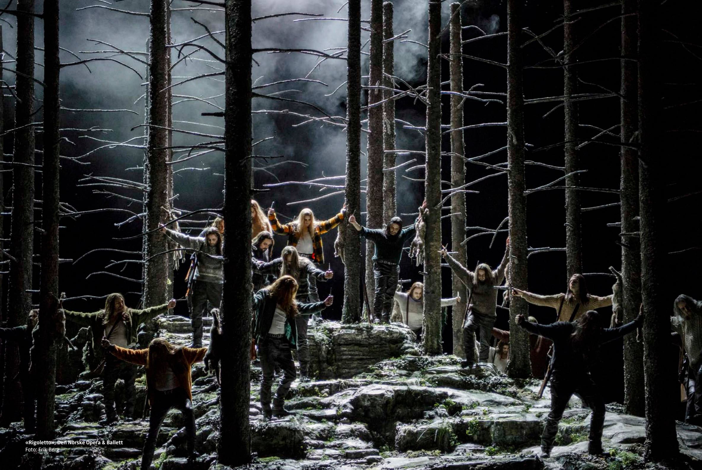
«Rigoletto», Den Norske Opera & Ballett

omfattet tilskudd til bedriftsnettverk som en del av oppdraget til Innovasjon Norge.