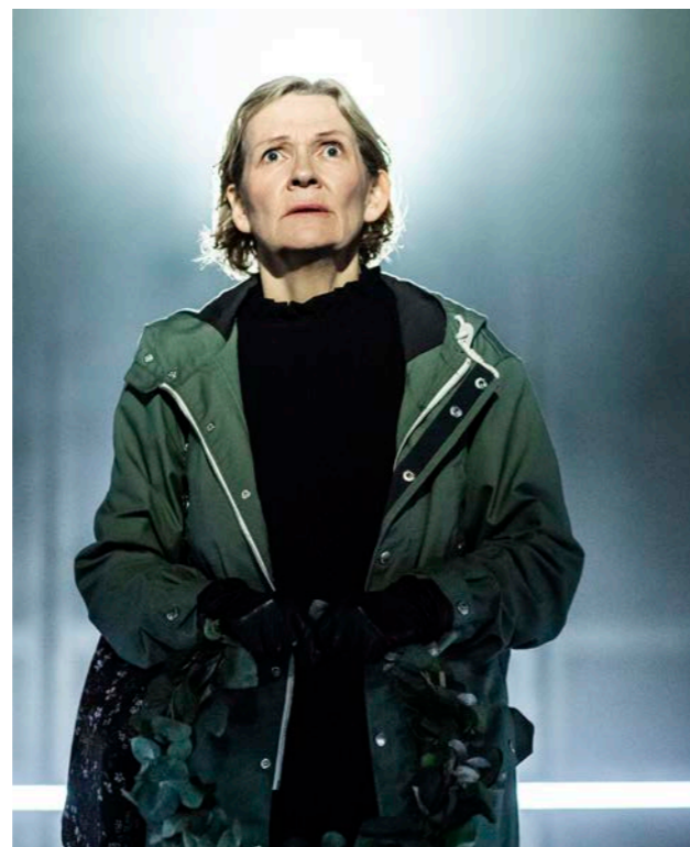
«Drøm om høsten», Hålogoland Teater

For å sikre ytringsmangfold og kvalitet i kritikken, er det behov for å styrke både den langsomme, dyptgående og analyserende kritikken i tidsskriftene og den mer umiddelbare og aktuelle kritikken i de allmenne og brede mediene.