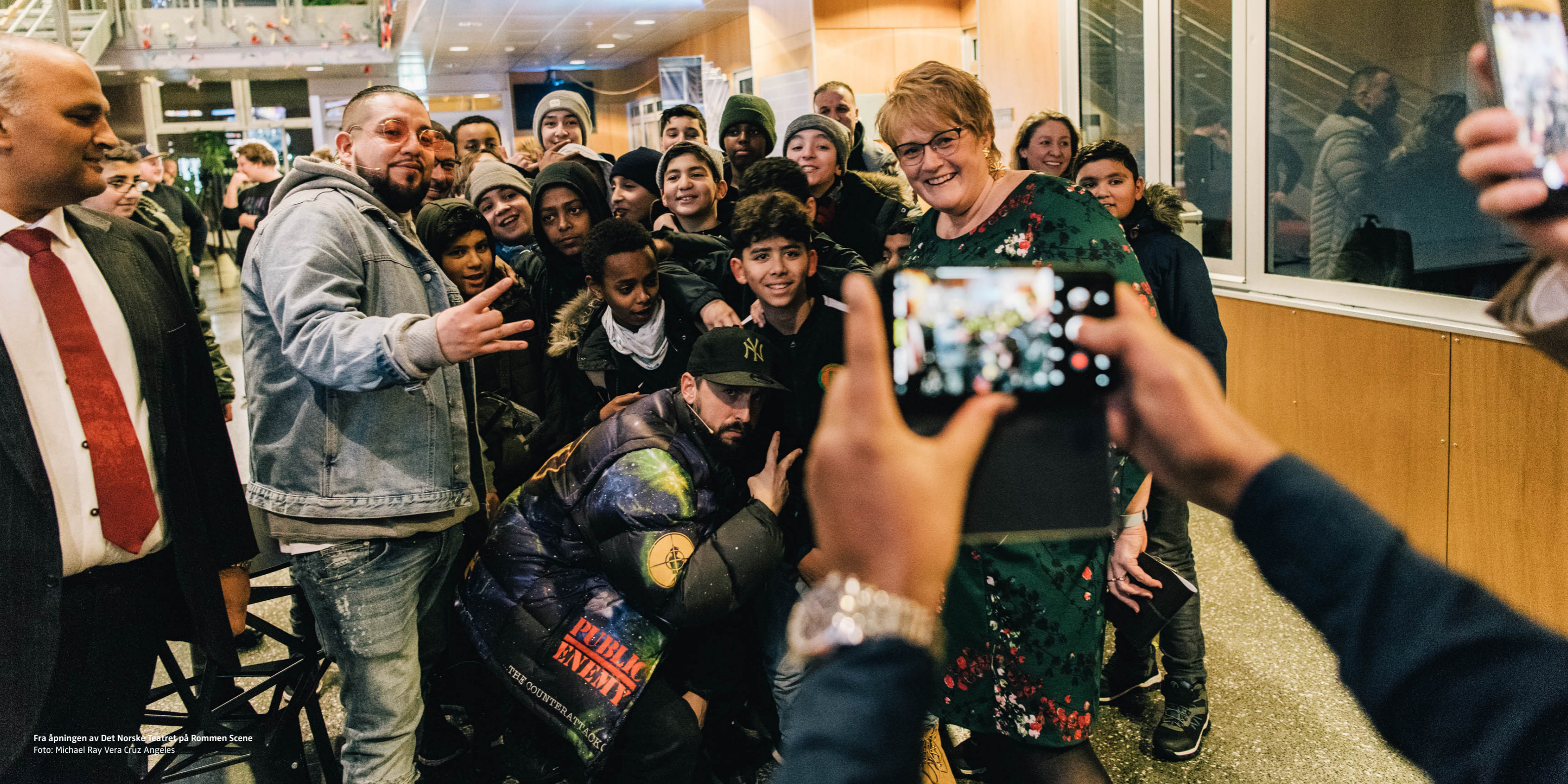
Fra åpningen av Det Norske Teatret på Rommen Scene