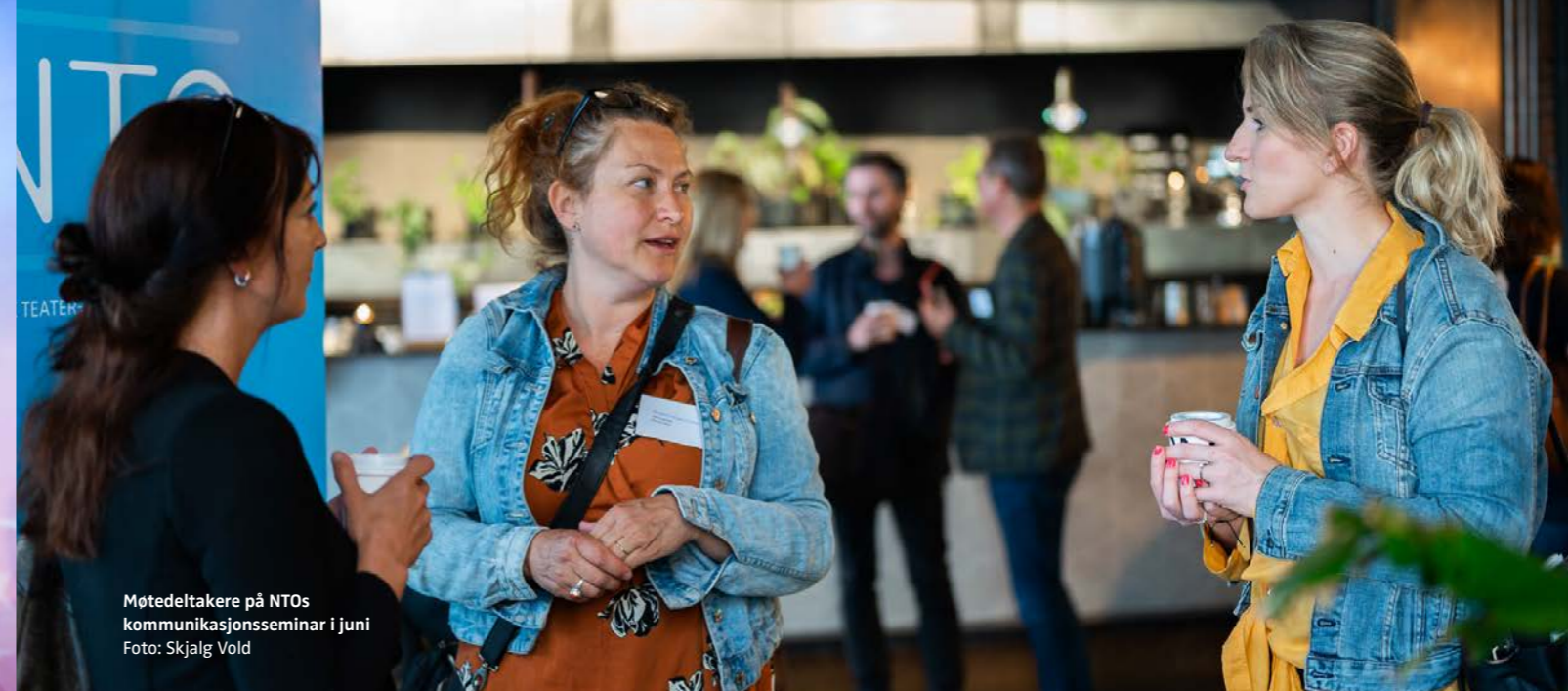
Møtedeltakere på NTOs kommunikasjonsseminar i juni