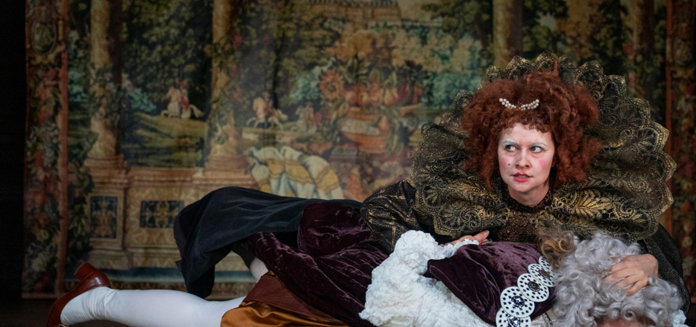
«En midtsommernattsdrøm», Haugesund Teater

Det er gledelig at regjeringen forslår å styrke kunstnerstipendene. Dette er likevel en beskjeden økning som innenfor musikken og scenekunsten monner lite sett i forhold til at institusjonene må redusere kunstfaglige årsverk som følge av ABE-reformen.