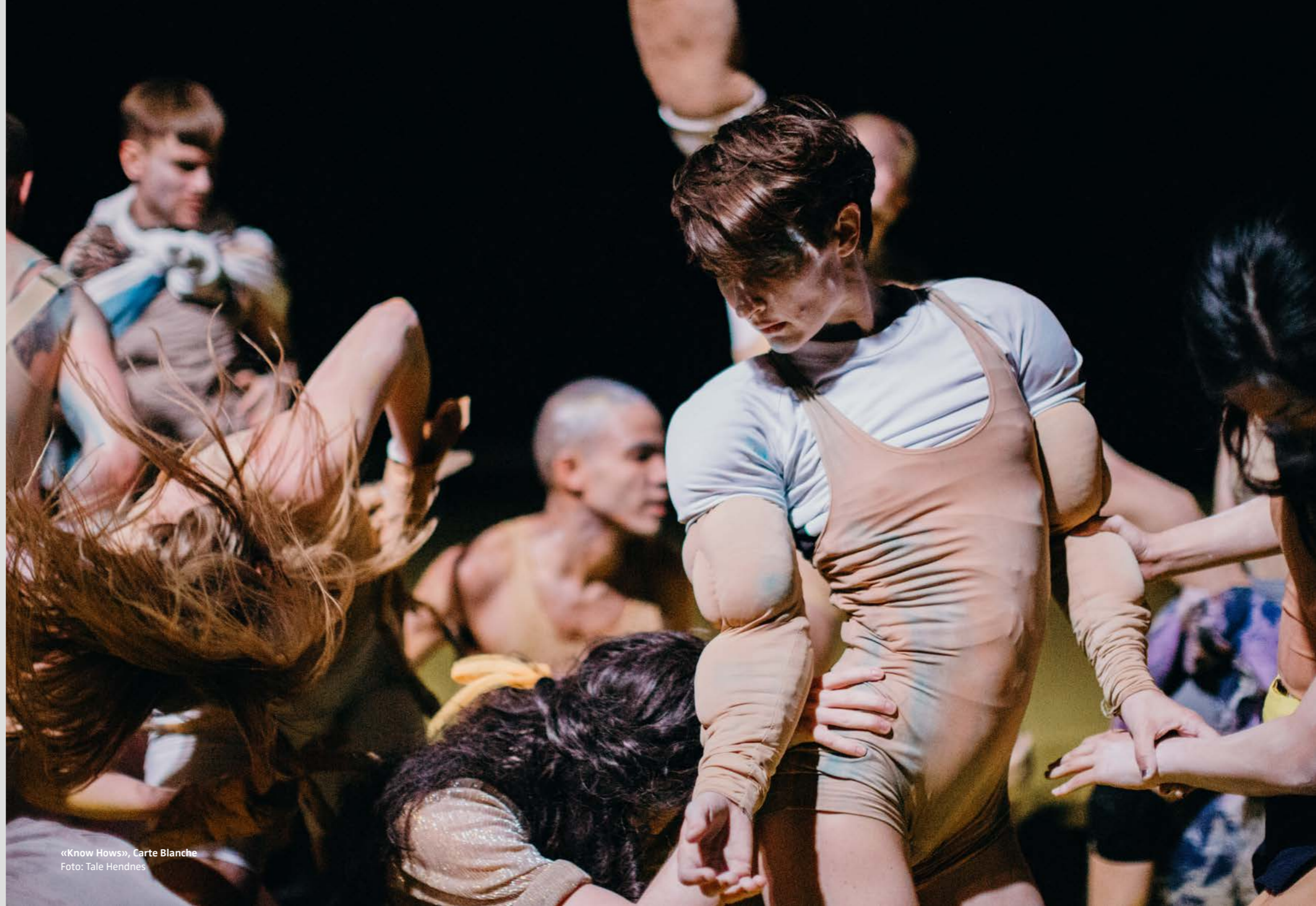
«Know Hows», Carte Blanche