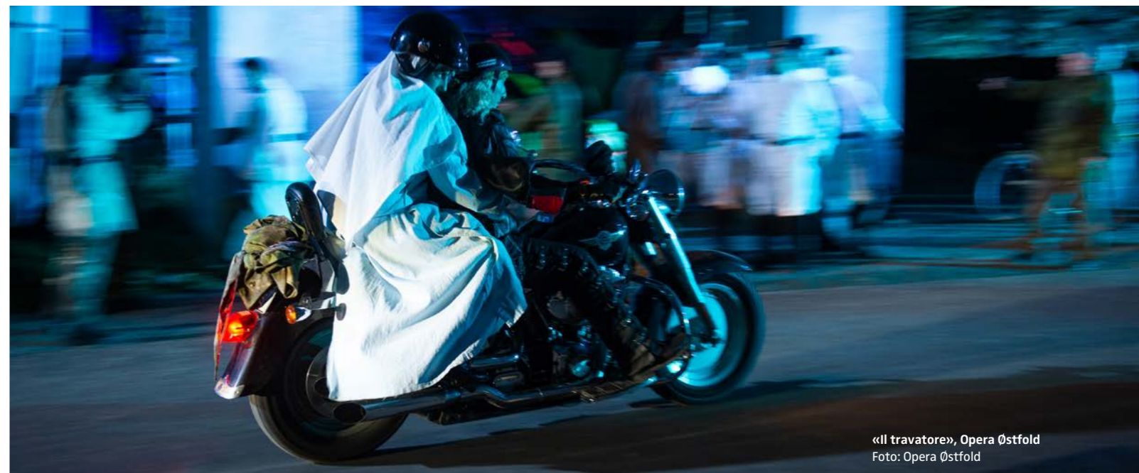
«Il travatore», Opera Østfold

Kunstneriske årsverk må reduseres, og det blir dermed færre arbeidsplasser og oppdrag for kunstnerne. Faste stillinger står allerede vakante eller avvikles, men i særlig grad går svekket økonomi utover mulighetene til å engasjere frilansere som dermed vil rammes merkbart dersom effektiviseringskuttet vedvarer.