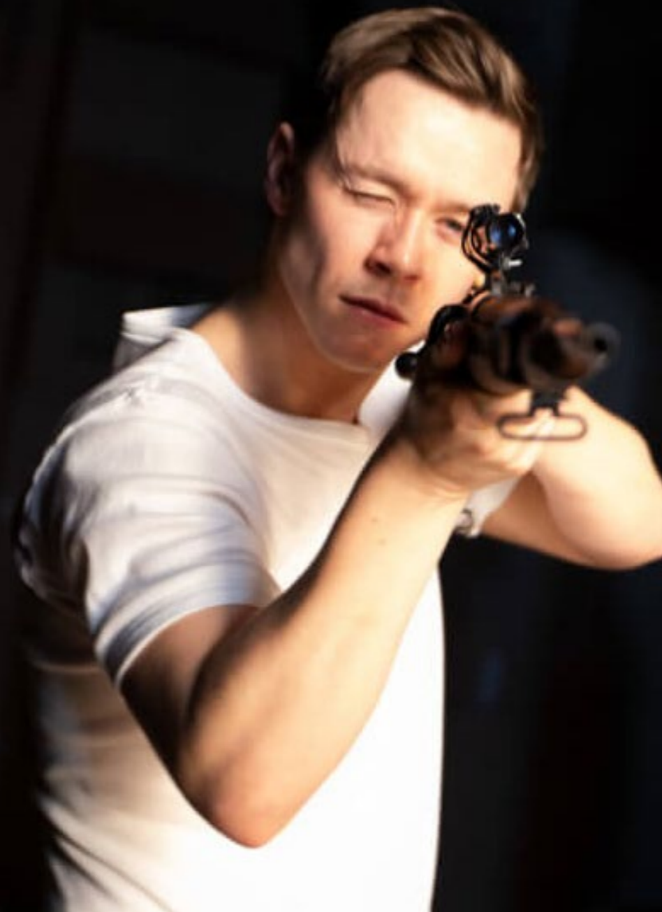
«Assassins», Den Nationale Scene

I Kulturrådets budsjetttrundskriv ble det vist til Barne- og ungdomskulturmeldingen fra 2021 som begrunnelse for det nye rapporteringskravet om