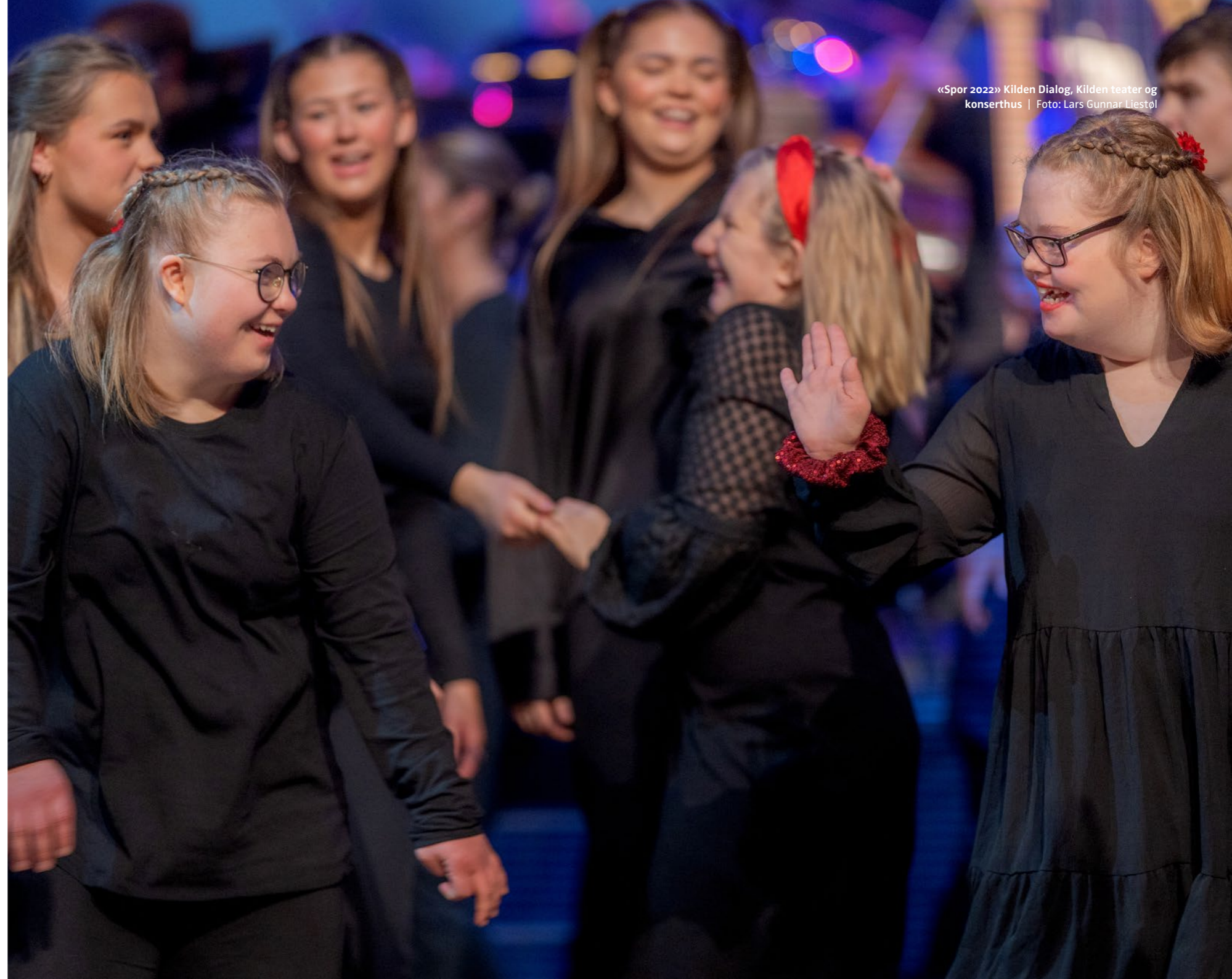
«Spor 2022» Kilden Dialog, Kilden teater og konserthus

Det skal legges betydelig vekt på kontinuitet for å sikre nødvendig kompetanse, balansert mot behovet for fornyelse og at flest mulig av NTOs medlemsvirksomheter over tid engasjeres i styre- og utvalgsarbeid.