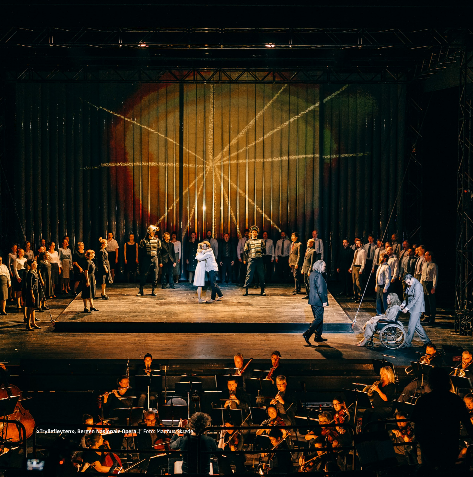
«Tryllefloyten», Bergen Nasjonale Opera