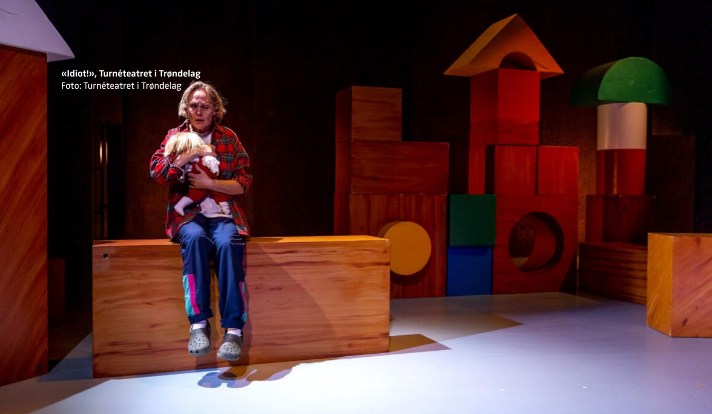
«Idiot!», Turnéteatret i Trøndelag

medvirkning fra barn og unge, trass i at den samme meldingen da den kom hadde blitt kraftig kritisert av regjeringspartiene. De var den gangen særlig opptatt av at det ikke skulle stilles politiske forventninger eller krav verken til institusjonenes produksjons- og formidlingsmetoder eller til hvem de skal samarbeide med.