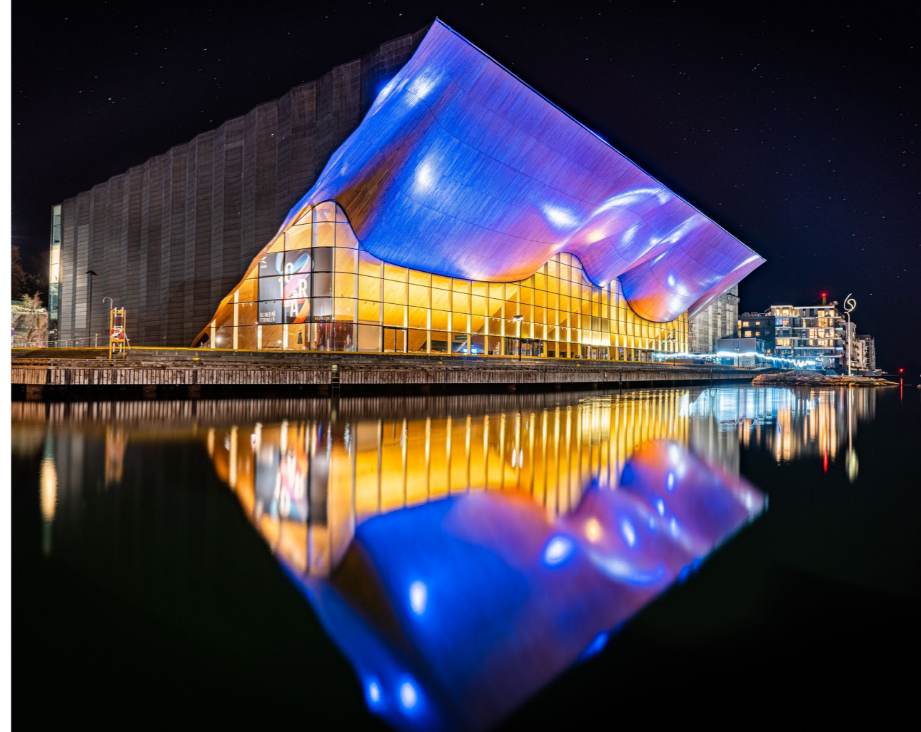
Kilden teater og konserthus.

NTO har ved utgangen av 2022 fire fast ansatte. Eksterne konsulenter benyttes når sakskomplekset krever det og økonomien tillater det. Styret har i 2022 hatt 9 møter, hvorav 2 ble gjennomført digitalt. Styremedlemmer i NTO mottar ikke honorar.