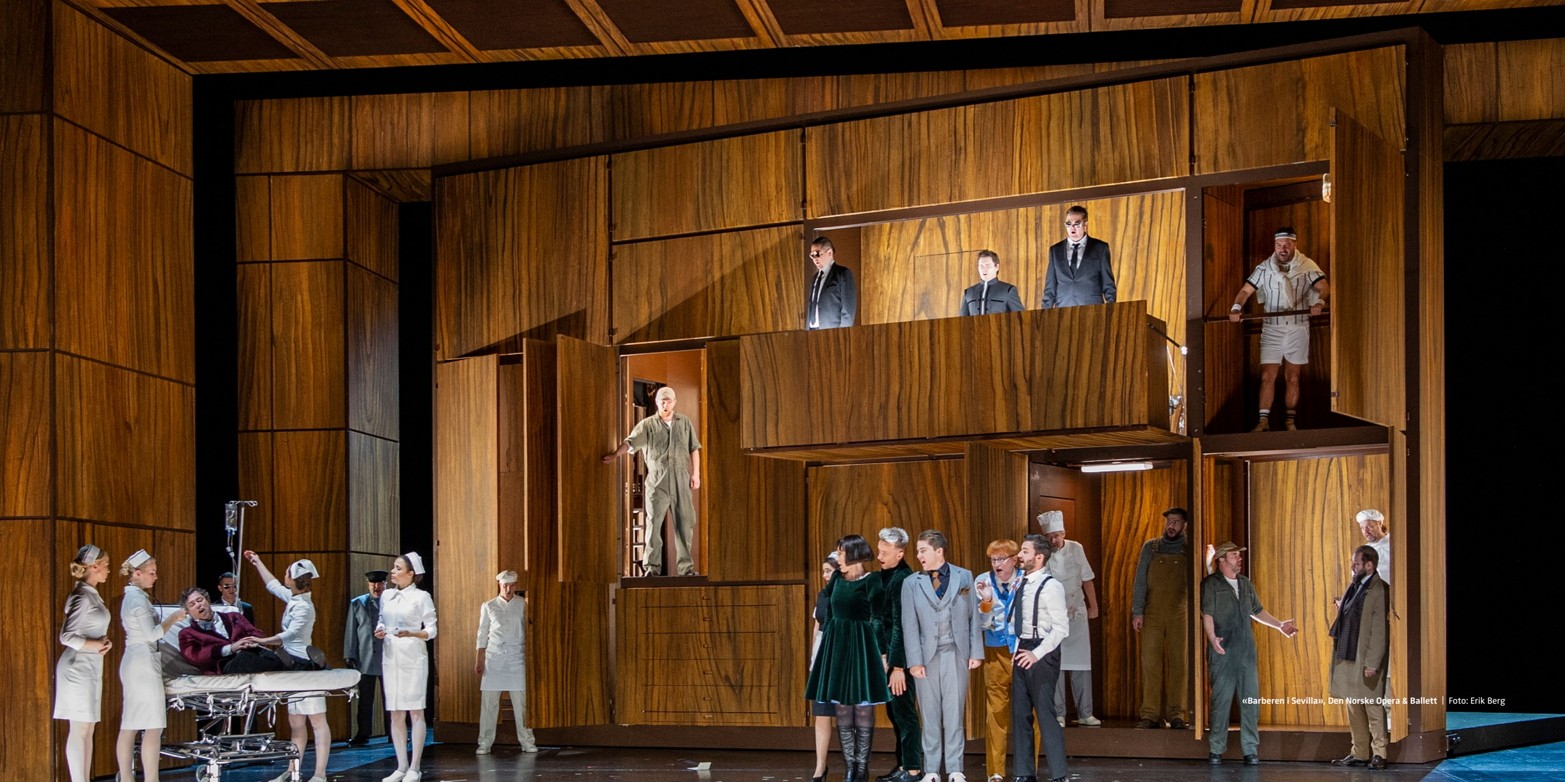
«Barberen i Sevilla», Den Norske Opera & Ballett