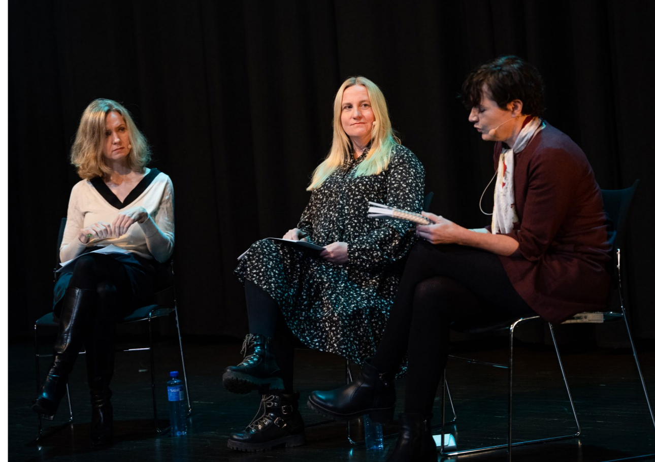
Årsmøteseminar.