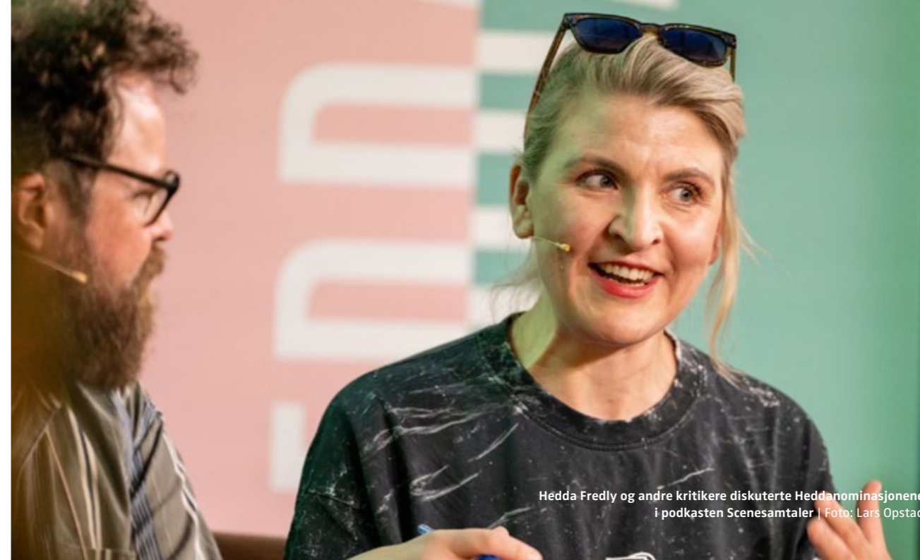
Hedda Fredly og andre kritikere diskuterte Heddanominasjonene i podkasten Scenesamtaler