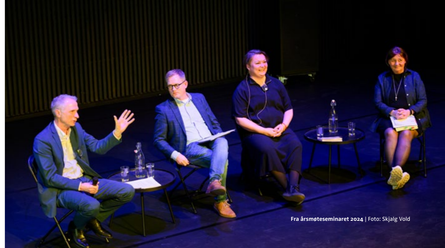
Fra årsmøteseminaret 2024